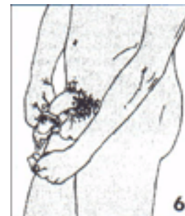
Utilice un condón nuevo si tiene relaciones sexuales otra vez o si tiene relaciones en otro sitio (vagina, boca o ano)