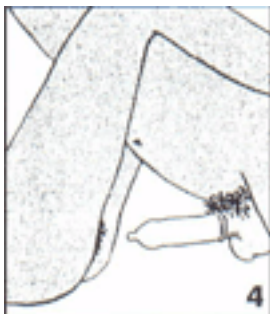
Después de la eyaculación, y cuando el pene aún esté erecto, retire el pene, sujetando el condón