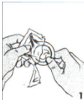
Abre con la mano el sobre

siempre coloque el condón antes de que el pene toque la vagina, la boca o el ano de la pareja. Verifique que el sobre del condón tenga aire y no esté dañado y que la fecha de vencimiento no esté pasada o que la fecha de fabricación esté dentro de los 5 años de su fabricación.