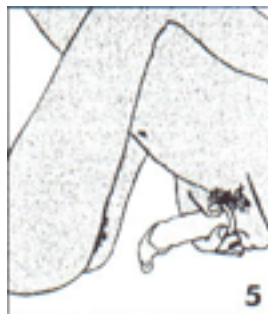
Quita el condón del pene y bóttalo a la basura